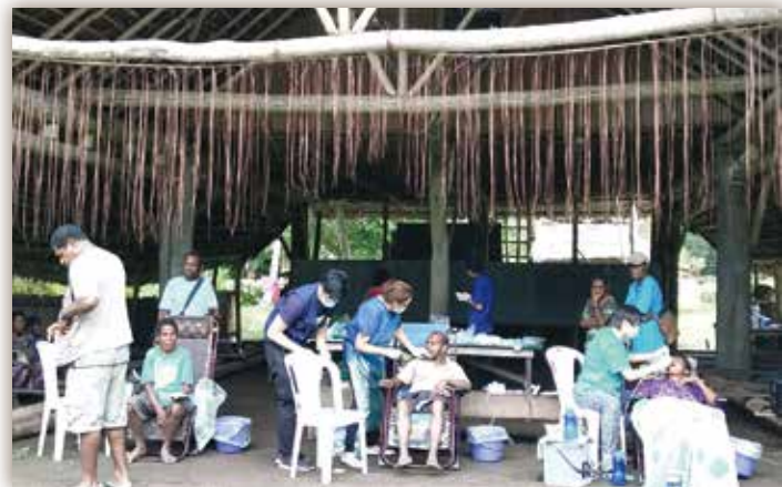
▲ 謝謝教會提供躺椅 牙科義診便利多多

莫茲比港為巴紐首都，中國開放後，到巴紐的華人急速增加，不少是非非法移工。莫茲比港華人教會由馬來西亞和澳洲華人衛理公會開拓，服事急速增加的華人。教會跟力慈關係深厚，每次短宣隊進出莫港，教會都竭力協助各種各樣需求，這次教會還買了五張躺椅寄到威瓦克，提供醫療隊為村民看病時使用。