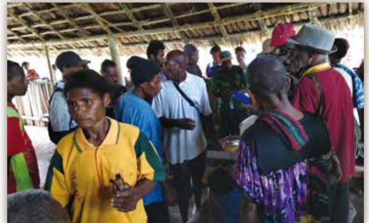
▲ 村民聚集，尋找合用的眼鏡

這次雖只有牙醫參隊，但出發前也應需求帶了好些酸痛貼布及噴劑、濕疹藥膏、眼藥水等。值得一記的是，為募集近視及老花眼鏡，單單兩三個群組貼上的訊息，竟吸引了全各地熱心人士的捐贈，加上中科院募集的太陽眼鏡，一個月內，2000多副二手或全新的眼鏡擠滿我的診所。這次因行李空間有限無法全部帶走，但小心翼翼帶到村中的200多副眼鏡，亦能滿足部份有近視、老花及白內障眼疾的村民了。