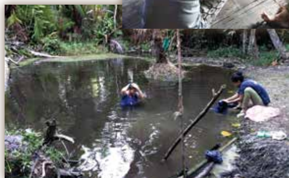
▲ 天天往來池塘泥水，但求洗淨一身疲憊